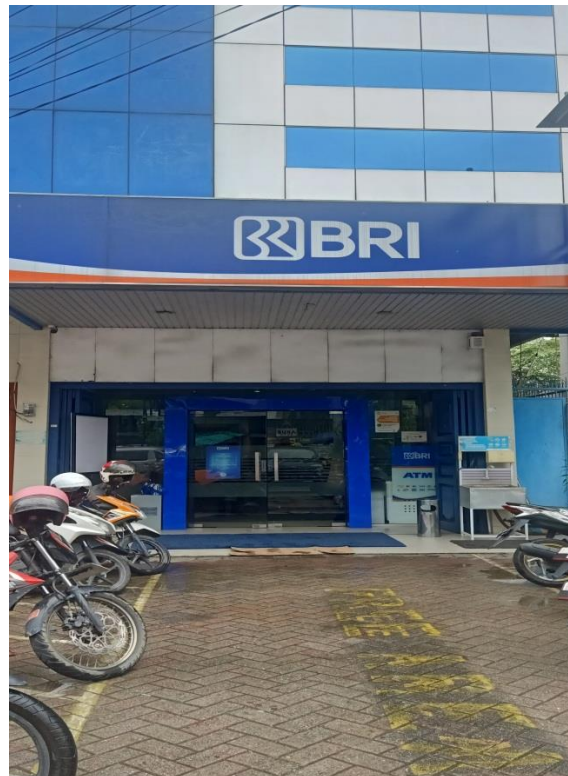
Gambar 1. BRI Kantor Cabang Pembantu Ahmad Yani

manfaat, dan fitur-fitur yang sudah tersedia di aplikasi BRImo serta keamanan yang terjamin dalam setiap transaksinya. Nasabah yang tidak paham dalam penggunaan aplikasi BRImo, setelah dijelaskan dan nasabah menjadi tertarik, kemudian diarahkan untuk mendaftar BRImo dengan ketentuan nomor telepon dan email masih aktif dari pertama membuka rekening tabungan, ada KTP asli dan yang mendaftar adalah pemilik rekening. Setelah terbentuknya akun BRImo nasabah, mahasiswa kemudian menjelaskan fitur-fitur yang tersedia di aplikasi BRImo serta menggunakannya dan cara menghindari adanya penipuan dengan tidak menelusuri link palsu yang diberikan melalui WhatsApp dengan mengatasnamakan bank BRI dengan tujuan membobol akun BRImo.