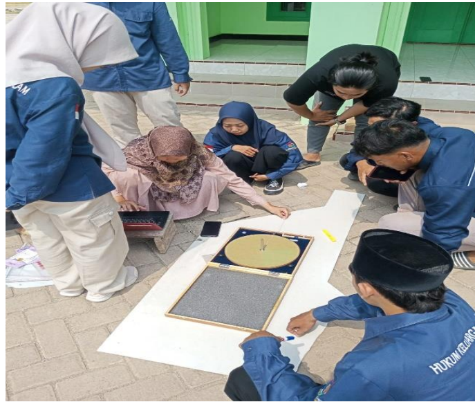
Gambar 1. Pemaparan Teknis Penggunaan Alat Rashdul Kiblat