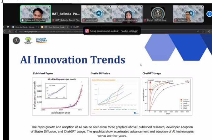
Gambar 1. Sesi Webinar Berlangsung

Pada sesi inti, pembicara memberikan materi mengenai pengenalan dasar AI serta perkembangannya, termasuk fakta bahwa terdapat 27.913 AI tools yang telah dikembangkan hingga Januari 2025. Pembicara menjelaskan berbagai alat AI yang dapat digunakan secara terpercaya untuk mendukung aktivitas pembelajaran, termasuk Consensus untuk penelitian akademis dan Perplexity sebagai alat pencarian informasi berbasis AI yang lebih akurat dibandingkan mesin pencari konvensional.