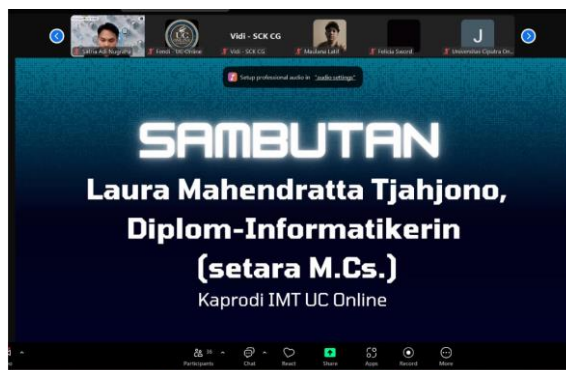
Gambar 2. Sesi Webinar Berlangsung

Sebagai bagian dari evaluasi, peserta diminta untuk mengisi post-test guna mengukur pemahaman mereka setelah mengikuti webinar. Panitia juga menjelaskan mekanisme distribusi e-certificate dan materi PDF kepada seluruh peserta sebagai dokumentasi dari kegiatan ini. Acara diakhiri dengan sesi penutupan yang menegaskan kembali pentingnya pemanfaatan AI dalam pendidikan. Dengan terselenggaranya webinar ini, diharapkan para guru dan tenaga pendidik dapat lebih memahami serta mengoptimalkan teknologi AI dalam mendukung proses pembelajaran yang lebih efektif dan efisien.