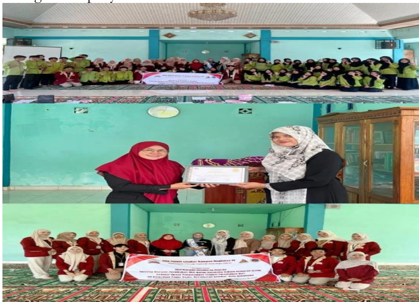
Gambar 3. Foto Bersama Peserta dan Penyerahan Sertifikat kepada Partner Proker KKN

Sebagai penutup, tim pengabdian juga mendistribusikan bahan bacaan cetak berupa brosur informatif berjudul "Jangan Korban Masa Depanmu, Katakan Tidak pada Pernikahan Dini." Brosur ini memuat ringkasan materi utama yang telah disampaikan selama penyuluhan, serta pesan-pesan kunci yang dirancang untuk menggugah kesadaran pembaca akan pentingnya menunda pernikahan hingga usia yang ideal dan matang. Pendistribusian brosur ini merupakan bagian dari strategi penyebaran informasi berkelanjutan yang dapat dijadikan referensi mandiri oleh peserta dan masyarakat luas setelah kegiatan selesai. Dengan demikian, harapan akan terwujudnya generasi muda yang sehat, cerdas, dan sadar hukum dapat terus diperjuangkan, bahkan di luar ruang forum penyuluhan.