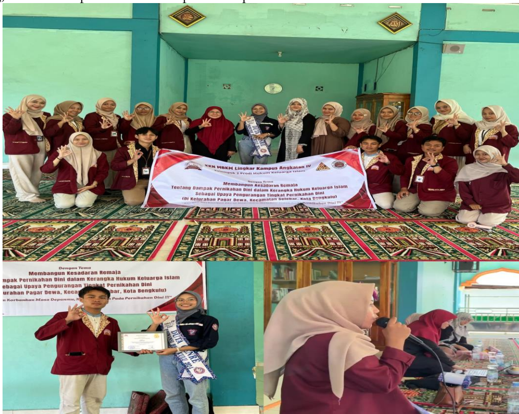
Gambar 1. Pembukaan Kegiatan Pengabdian dan Penyampaian Narasumber Sesi 1

Sesi kedua dilanjutkan pada pukul 09.55 hingga 10.15 WIB dengan menghadirkan narasumber kedua yang membahas peran keluarga, masyarakat, dan lembaga pendidikan dalam mencegah pernikahan dini. Materi ini memberikan penekanan pada strategi kolaboratif dalam menciptakan lingkungan sosial yang mendukung tumbuh kembang anak dan remaja secara optimal, baik secara fisik, psikologis, maupun spiritual. Narasumber juga menekankan pentingnya pendidikan nilai-nilai keislaman yang humanis, inklusif, dan relevan dengan dinamika zaman. Dengan penyampaian materi yang sistematis dan interaktif, sesi ini diharapkan mampu meningkatkan pemahaman peserta mengenai pentingnya menunda pernikahan hingga usia yang matang, baik dari aspek hukum maupun kesiapan mental dan sosial.