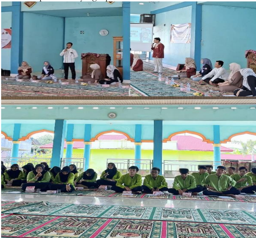
Gambar 1. Pembukaan Kegiatan Pengabdian

Kegiatan Pengabdian kepada Masyarakat ini “Edukasi Penanggulangan Tingkat Pernikahan Dini” diawali dengan sambutan sekaligus pembukaan kegiatan oleh Dosen Pembimbing Lapangan (DPL) KKN MBKM (Lingkar Kampus) dan diakhir pembukaan ditutup dengan membacakan doa yang dipimpin langsung oleh ketua kelompok 2 kkn mbkm (lingkar kampus) . Setelah pembukaan tim panitia kemudian mengkondisikan peserta (objek) bersiap-siap menerima materi yang akan disampaikan oleh 2 narasumber yang dibagi menjadi 2 sesi, sesi I dimulai pukul 09.25-9.55 WIB. dan sesi II dimulai pukul 09.55-10.15 WIB. Acara inti yaitu penyampaian materi dari kedua narasumber pada sesi 1 yang dipandu oleh moderator.