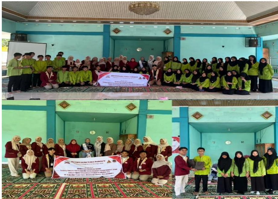
Gambar 5. Tanya Jawab Sesi 2 dan Foto Bersama Peserta

Adapun tingkat keberhasilan Kegiatan Pengabdian kepada Masyarakat Kolaborasi bekerjasama Kolaborasi Pemerintah Dan Lembaga Pendidikan Untuk Menanggulangi Tingkat Pernikahan Dini (Di Kelurahan Pagar Dewa, Kecamatan Selebar, Kota Bengkulu) dapat diukur berdasarkan poin-poin berikut: