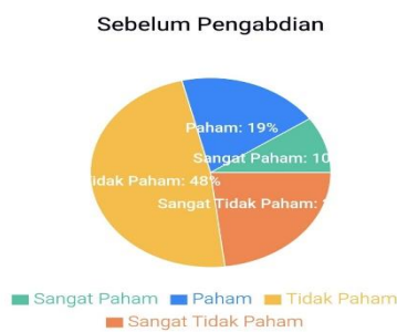
Pemahaman Responden tentang Penanggulangan Pernikahan Dini (52 Orang)

pengisian kuesioner sebelum dan setelah pelaksanaan kegiatan kemudian dianalisis dengan teknik statistik, dimana data kuesioner setiap peserta dikonversi dalam kategorisasi yaitu sudah paham materi dan belum paham dengan yang disajikan dalam kegiatan pengabdian. Dari data awal sebelum pelaksanaan pengabdian diperoleh hasil bahwa terdapat 31% peserta sudah paham materi dan 69 % belum paham. Perubahan yang cukup signifikan terlihat ketika data akhir telah diolah, hasilnya adalah 92% peserta merasa sudah memahami materi setelah diberikan penjelasan saat mengikuti kegiatan pengabdian, dan 8% peserta yang belum memahami materi setelah mengikuti kegiatan pengabdian. Artinya peserta kegiatan pengabdian ini telah memiliki peningkatan pengetahuan, pemahaman, dan keterampilan mengenai hal-hal apa saja yang harus dilakukan sebagai upaya penanggulangan. Berikut gambaran perubahan pengetahuan, pemahaman, dan keterampilan peserta sebelum dan setelah mengikuti kegiatan pengabdian penanggulangan pernikahan dini: