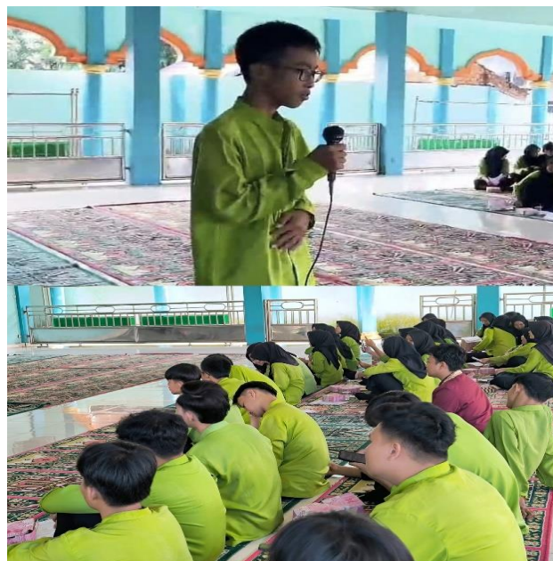
Gambar 3. Sesi Tanya Jawab 1

Setelah penyampaian materi, kegiatan kemudian dilanjutkan dengan membuka sesi tanya jawab terkait dengan materi yang telah disampaikan oleh narasumber. Peserta cukup antusias bertanya.