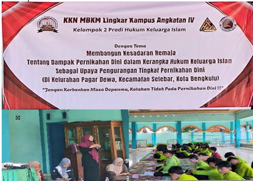
Gambar 2. Penyampaian Narasumber Sesi 1

Narasumber pertama dari pihak program studi hukum keluarga islam membahas mengenai hal-hal yang berkaitan dengan pernikahan dini dari segi agama islam. Narasumber menjelaskan tentang Islam dan Pernikahan di bawah umur. Meliputi, definisi pernikahan dalam islam, Dasar Hukum Pernikahan, Tujuan pernikahan dalam islam, Tanggung jawab dalam pernikahan, Maqashid di laksanakannya pernikahan, Alasan pernikahan dini harus di hindari, Islam menyuruh menikah tapi dengan kematangan, diakhiri dengan materi remaja bijak rencanakan masa depan cerah.