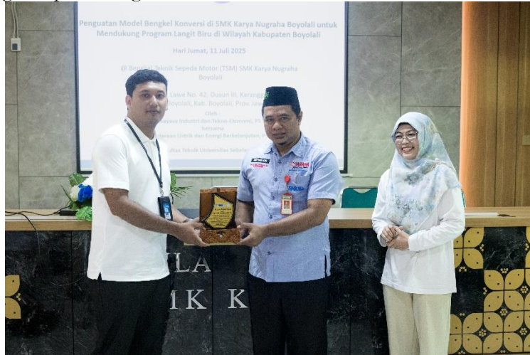
Gambar 1. Kerjasama program Penguatan Bengkel Konversi

menjadi kendaraan listrik. Tidak hanya itu, kemampuan praktik juga mengalami peningkatan, terlihat dari keberhasilan peserta dalam melakukan perakitan komponen, pengujian kinerja, hingga penanganan masalah teknis sederhana di bengkel sekolah. Peningkatan ini mengindikasikan bahwa pendekatan pembelajaran yang menggabungkan teori, praktik langsung, dan simulasi lapangan memberikan dampak positif terhadap proses transfer keterampilan. Hal ini sejalan dengan hasil penelitian sebelumnya yang menegaskan bahwa pembelajaran vokasi berbasis praktik dapat mempercepat penguasaan keterampilan sekaligus meningkatkan kepercayaan diri peserta dalam menghadapi tantangan teknis.