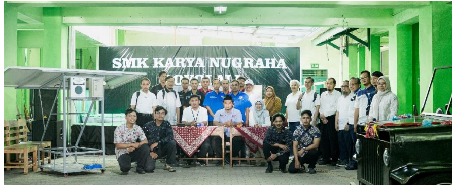
Gambar 3. Kolaborasi Multipihak

Lebih jauh, model kolaborasi ini memberikan kontribusi nyata terhadap pencapaian Sustainable Development Goals (SDGs), khususnya SDG 9, yaitu membangun infrastruktur yang tangguh, mendorong industrialisasi inklusif, dan mengembangkan inovasi. Implementasi program menunjukkan bahwa sekolah bukan hanya penerima manfaat, melainkan juga aktor aktif dalam inovasi teknologi energi bersih. Keberhasilan tersebut telah menumbuhkan rasa percaya diri sekaligus meningkatkan kapabilitas sekolah dalam mengelola program-program berbasis teknologi, menjadikannya pionir dalam pendidikan vokasi yang relevan dengan isu energi terbarukan dan kendaraan ramah lingkungan.