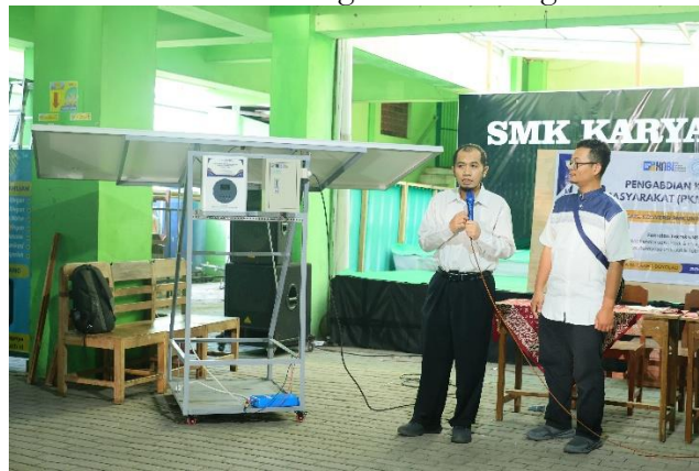
Gambar 2. Penerapan praktik sistem EBT

Sistem ini dirancang sebagai representasi ekosistem energi bersih skala mikro, yang mengintegrasikan secara cerdas tiga komponen utama: panel surya sebagai penangkap energi matahari, inverter sebagai pengonversi arus searah menjadi arus bolak-balik, dan baterai penyimpanan sebagai penyimpan daya untuk pemanfaatan berkelanjutan. Integrasi ketiga komponen tersebut bukan hanya menunjukkan kecanggihan desain teknis, tetapi juga menegaskan pentingnya pemahaman sistemik dalam membangun solusi energi terbarukan.