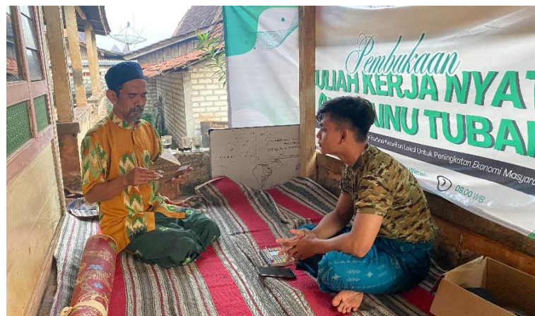
Gambar 2. Kontribusi Proses Penyusunan Bacaan Tahlil

Pendekatan yang digunakan dalam kegiatan ini adalah Asset-Based Community Development (ABCD), yang menitikberatkan pada penguatan aset lokal sebagai fondasi pembangunan masyarakat. Dalam implementasinya, mahasiswa tidak memposisikan diri sebagai pihak yang membawa solusi dari luar, melainkan sebagai fasilitator yang menggali dan mengembangkan potensi yang telah ada. Temuan menunjukkan bahwa pendekatan ini mampu membangun kepercayaan masyarakat secara lebih efektif, karena program yang dijalankan selaras dengan kebutuhan dan nilai-nilai yang hidup di masyarakat. Hal ini sejalan dengan Kretzmann dan McKnight (1993) yang menegaskan bahwa pembangunan berbasis aset lokal lebih berkelanjutan dibandingkan pendekatan berbasis kebutuhan ( needs-based approach ), karena masyarakat menjadi subjek utama dalam proses perubahan.