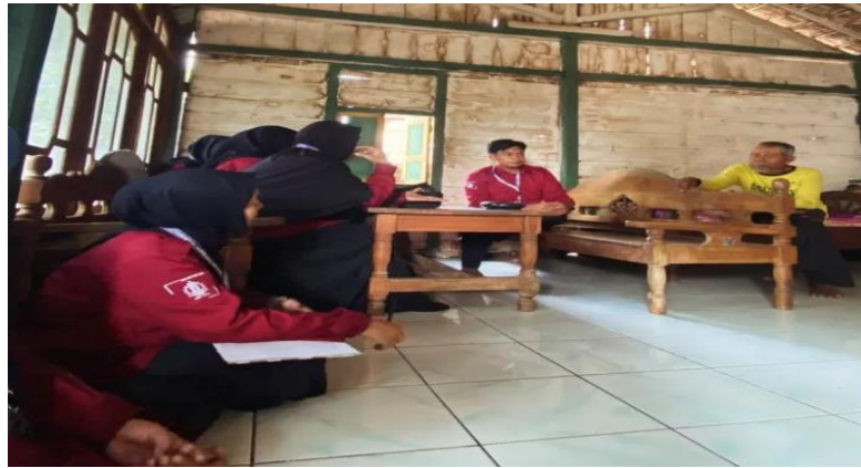
Gambar 1. Kontribusi Juru Kunci Makam Mbah Buyut Ndukoh

Temuan tersebut memperkuat pandangan bahwa praktik keagamaan masyarakat tidak dapat dilepaskan dari struktur sosial dan budaya yang melingkupinya. Geertz (1960) menjelaskan bahwa agama dalam masyarakat Jawa merupakan sistem makna yang terintegrasi dengan kehidupan sosial, sehingga setiap praktik keagamaan selalu memiliki dimensi kultural yang kuat. Dengan demikian, upaya pendampingan yang dilakukan mahasiswa tidak sekadar menyusun buku tuntunan, tetapi juga berkontribusi dalam menjaga keberlangsungan sistem sosial yang berbasis nilai-nilai religius.