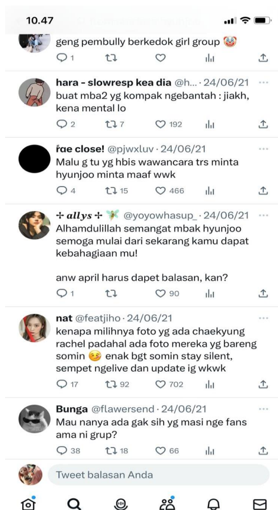
Gambar 4. Postingan dari Akun Base yang Ramai Mendapat Atensi

Berdasarkan gambar diatas dapat diketahui bahwa perilaku fanatisme hanya akan menerima berita berdasarkan keinginannya. Meskipun data telah dilampirkan jika pelaku fanatisme tidak ingin menerima data tersebut, maka dia tetap tidak akan menerima data tersebut dan terus mempertahankan pendapatnya berdasarkan asumsinya.