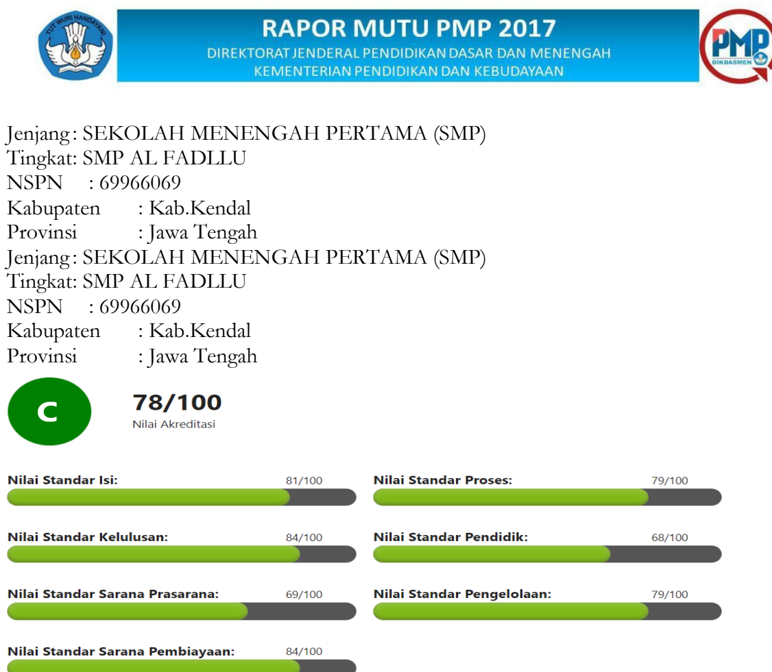
Gambar 2. Rapot Mutu SMP Al Fadllu Kabupaten Kendal

Kelengkapan dokumen dari setiap penyelenggaraan sistem penjaminan mutu internal menjadi tolak ukur dalam penetapan atau perencanaan kembali standar mutu yang perlu diperbaiki. Dengan demikian tim pengembangan mutu sekolah tidak perlu melakukan perencanaan ulang melainkan melakukan perencanaan lanjutan saja, atau meneruskan dan mengurangi atau menambahkan rencana yang sudah di tetapkan. Dari hasil penerapan tersebut dapat dilihat perubahan dan penilaian dari pemenuhan seluruh standar nasional pendidikan yang menjadi skala prioritas untuk di lakukan perubahan yaitu ada empat standar (standar kompetensi lulusan, standar isi, standar proses dan standar penilaian) dan empat standar yang belum di lakukan perubahan tetapi sejalan dengan diterapkannya SPMI ikut meningkat pula. Hal ini dapat dilihat dalam gambar 2 berikut ini.