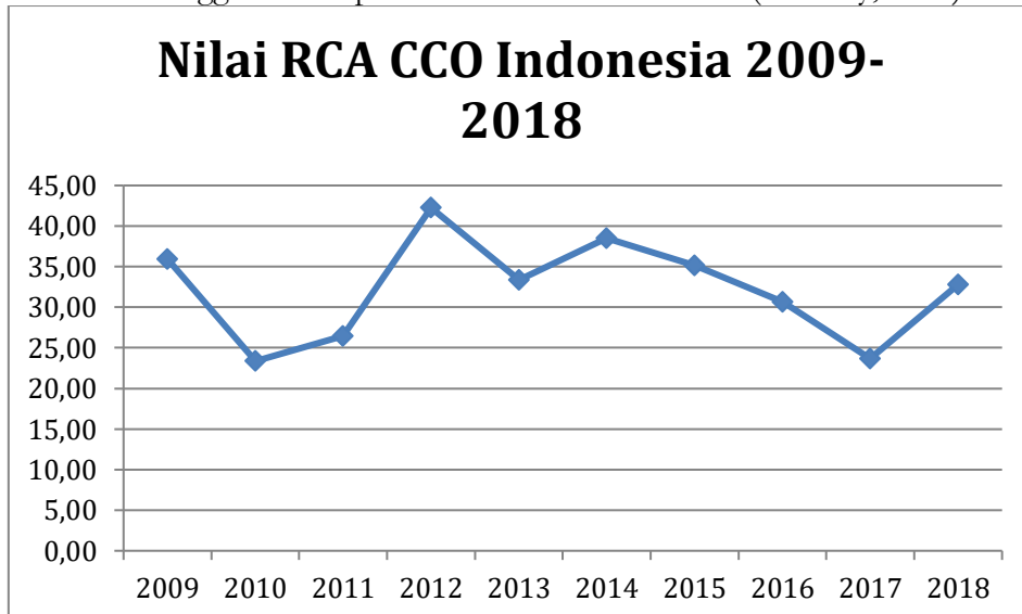
Gambar 2. Nilai RCA Crystal coconut sugar Indonesia Tahun 2009-2018.