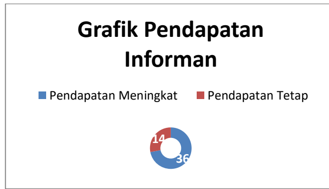
Gambar 1. Hasil wawancara dampak pembebasan lahan tol terhadap pendapatan masyarakat terdampak

Gambar 1 diatas menjelaskan bahwa dengan transformasi yang terjadi pada jenis pekerjaan yang tersedia bagi masyarakat dan peluang kerja baru yang muncul, terdapat kontribusi signifikan terhadap perubahan pendapatan di kalangan masyarakat (Mahaputra, 2019). Pasca pembangunan jalan tol Probowangi, sebagian besar warga Alasumur Lor mengalami peningkatan pendapatan, seiring dengan adanya peluang kerja baru yang dihasilkan oleh proyek tersebut (Siswanto et al., 2019). Meskipun demikian, beberapa warga yang tidak mengalami peningkatan pendapatan setelah diwawancara menyatakan bahwa hal tersebut disebabkan oleh kelangsungan usaha yang tetap dan modal yang tidak mengalami peningkatan.