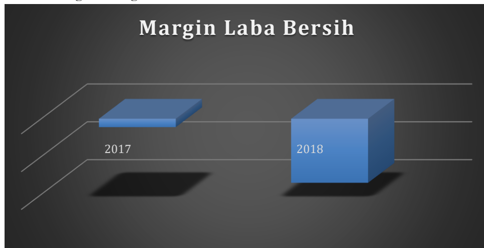
Gambar 1. Grafik Margin Laba Bersih

Dari data Margin Laba Bersih diatas disimpulkan bahwa pada tahun 2018 PT. Inti Agri Resources Tbk dan Entitas Anak mengalami kerugian sebesar Rp15.074.081.971 di mana hal tersebut menunjukkan bahwa laba bersih mengalami peningkatan kerugian dari tahun 2017 dan penjualan pada tahun 2018 mengalami penurunan dari tahun sebelumnya sebesar Rp79.728.867.002, sebagaimana gambar 1 di bawah ini.