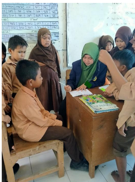
Gambar 2. Pengisian Kuisisioner Oleh Peserta Didik.

Peneliti juga mendokumentasikan tindakan selama prosedur penelitian, terutama dengan mendokumentasikan proses pengisian kuesioner siswa.