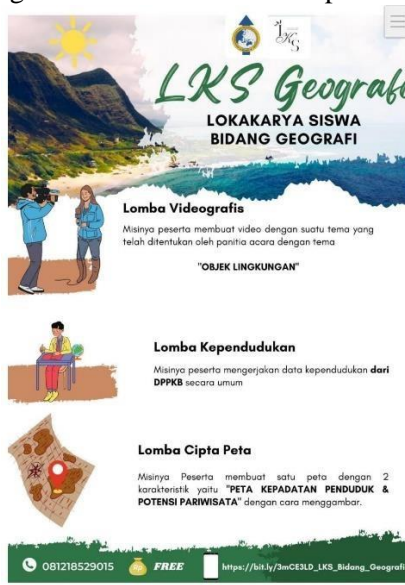
Gambar 2. Poster Digital Kegiatan Lomba Siswa

Selanjutnya, berdasarkan hasil wawancara analisis dokumentasi, pengaruh positif lainnya yang dihasilkan dengan keterlibatan anggota dalam pengambilan keputusan pada MGMP ini adalah munculnya kreativitas-kreativitas baru, contoh dalam mengadakan lomba tahunan untuk siswa SMA, biasanya lomba yang diselenggarakan hanya dalam bentuk olimpiade atau kuis. Sekarang, ada beberapa jenis perlombaan baru, seperti membuat video dokumentasi tentang lingkungan dan membuat peta sistem informasi geografi. Semua itu merupakan ide-ide/masukan dari anggota MGMP. Peningkatan kreativitas juga terlihat dari media pendukung informasi, seperti poster, undangan kegiatan, proposal kegiatan, yang dikemas dengan lebih menarik dan modern dalam bentuk digital, sebagaimana salah satu contoh pada Gambar 2 berikut ini.