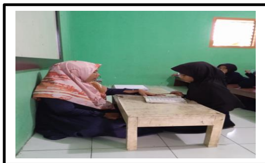
Gambar 8. Kegiatan anak mengaji

Berdasarkan hasil observasi yang sudah dilakukan di lapangan pada hari Sabtu 16 April 2023 tentang sikap saling mendukung antara orang tua dan anak tampak orang tua yang selalu mendukung kegiatan yang dilakukan anak seperti yang terlihat pada gambar 8 anak mengikuti kegiatan mengaji dan sangat mendapatkan dukungan dari orang tua, orang tua memberikan dukungan dari segi moral dan material. Ketika berkomunikasi juga adanya sikap saling mendukung untuk terjalinnya komunikasi antara orang tua dan anak walaupun komunikasi yang terjalin tidak begitu sering terutama pada ayah karena jarang pulang karena bekerja sebagai buruh antar barang. Berbeda dengan ibu yang lebih sering berkomunikasi dengan anak karena lebih sering berada di rumah walaupun ibu juga bekerja. Tidak ditemukan anak yang suka berkata kotor, kasar dan bersikap sombong.