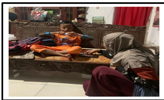
Gambar 2. Sikap tidak sopan anak kepada orang tua

Berdasarkan hasil observasi yang terlihat pada gambar 2 menunjukkan sikap negatif anak yang tidak sopan saat berbicara dengan orang tuanya anak duduk di atas kursi sedangkan orang tuanya duduk di bawah. Hal ini membuktikan bahwa dari hasil wawancara anak berkata tidak jujur, karena pada saat observasi yang ditemukan dilapangan dalam sikap positif anak tidak mencerminkan hal seperti itu.