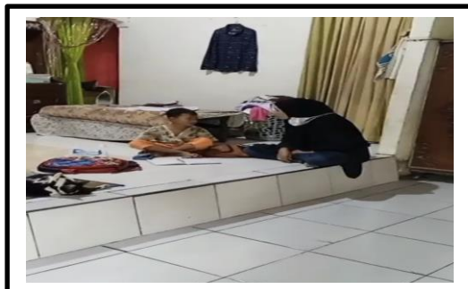
Gambar 6. Orang tua memarahi anak karena dapat nilai pelajaran kecil

memotong omongan dengan membicarakan hal lain dan suka sibuk sendiri minta diambilkan barang oleh orang tuanya.