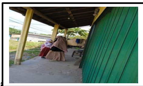
Gambar 3. Sikap hormat anak kepada orang tua

Berdasarkan hasil observasi pada tanggal 20 April 2023 pada hari Kamis, terlihat pada gambar 3 sikap positif anak hormat kepada orang tuanya dengan cara berpamitan salim tangan orang tua saat mau berangkat sekolah. Sikap hormat bukanlah sikap yang muncul secara tiba-tiba pada anak namun perlu diajarkan kepada anak agar menjadi terbiasa seperti pada gambar ibu selalu membiasakan dan mengajari anak untuk salim sebelum berangkat sekolah karena ketika anak salim, ia akan belajar bahwa ada orang-orang yang harus ia hormati seperti orang tua, kakek dan nenek, hingga guru-guru mereka di sekolah. Selain itu, dengan salim anak-anak akan belajar tentang apa yang boleh dan tidak boleh dilakukan kepada orang yang lebih tua seperti berbicara dengan berteriak atau berbicara dengan bahasa yang santun. Ketika salim anak juga akan merasakan kontak langsung dengan orang tua dan menumbuhkan kedekatan dengan orang tua dan menimbulkan rasa sayang dan rasa memiliki terhadap satu sama lain yang melakukannya.