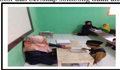
Gambar 7. Kegiatan mengaji anak

Berdasarkan hasil observasi di lapangan pada hari minggu 30 April 2023 terkait dengan sikap saling mendukung ditemukan bahwasanya orang tua selalu mendukung setiap kegiatan yang ingin dilakukan oleh anak dalam hal positif. Dukungan yang diberikan oleh orang tua berupa dukungan moral dan material seperti saat anak ingin mengikuti kegiatan ekstrakurikuler tekwondo dan ingin membeli perlengkapan seperti baju tekwondo orang tua memberikan uang untuk membeli dengan kata lain orang tua mendukung kegiatan yang diikuti anak dari segi material. Selain itu, anak juga mengikuti kegiatan diluar sekolah yaitu mengaji orang tua sangat mendukung kegiatan tersebut, hal ini dibuktikan dengan hasil observasi pada gambar 7 dimana anak yang sedang mengikuti kegiatan mengaji dan orang tua sangat mendukung kegiatan positif yang dilakukan anak dan selalu mencoba untuk memenuhi dan mendukung kegiatan anak. Sedangkan untuk berkata kasar, kotor dan bersikap sombong tidak ditemukan pada saat observasi di lapangan.