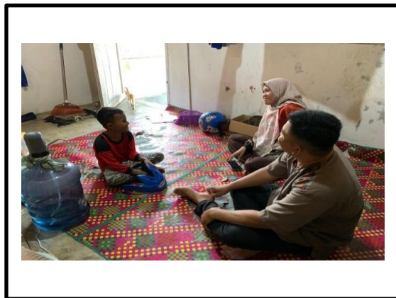
Gambar 1. Foto komunikasi orang tua dan anak

Hasil observasi terlihat pada gambar 1 orang tua dan anak yang sedang kumpul karena orang tua libur bekerja sehingga orang tua meluangkan waktu untuk berkomunikasi dengan anak. Orang tua menanyakan kegiatan di sekolah belajar apa saja dan menanyakan apakah ada masalah di sekolah, serta menceritakan hal-hal random untuk menjalin komunikasi dengan anak.