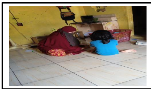
Gambar 5. Komunikasi ibu dan anak untuk menjalin keakraban

menjalin kedekatan dengan anak. Selain itu ditemukan juga anak masih suka berbicara dengan nada yang tinggi kepada orang tua